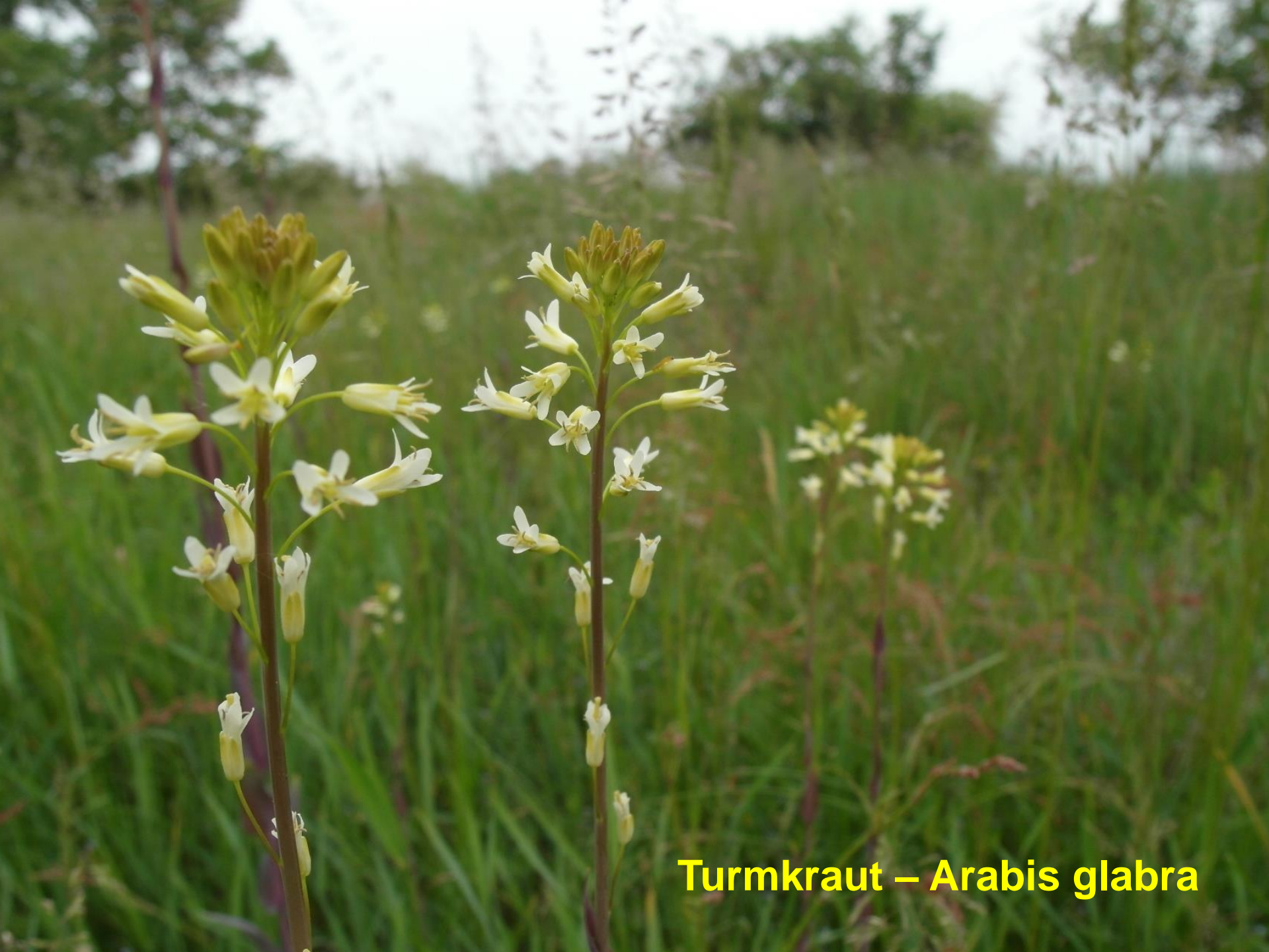
Turmkrout – Arabis glabra