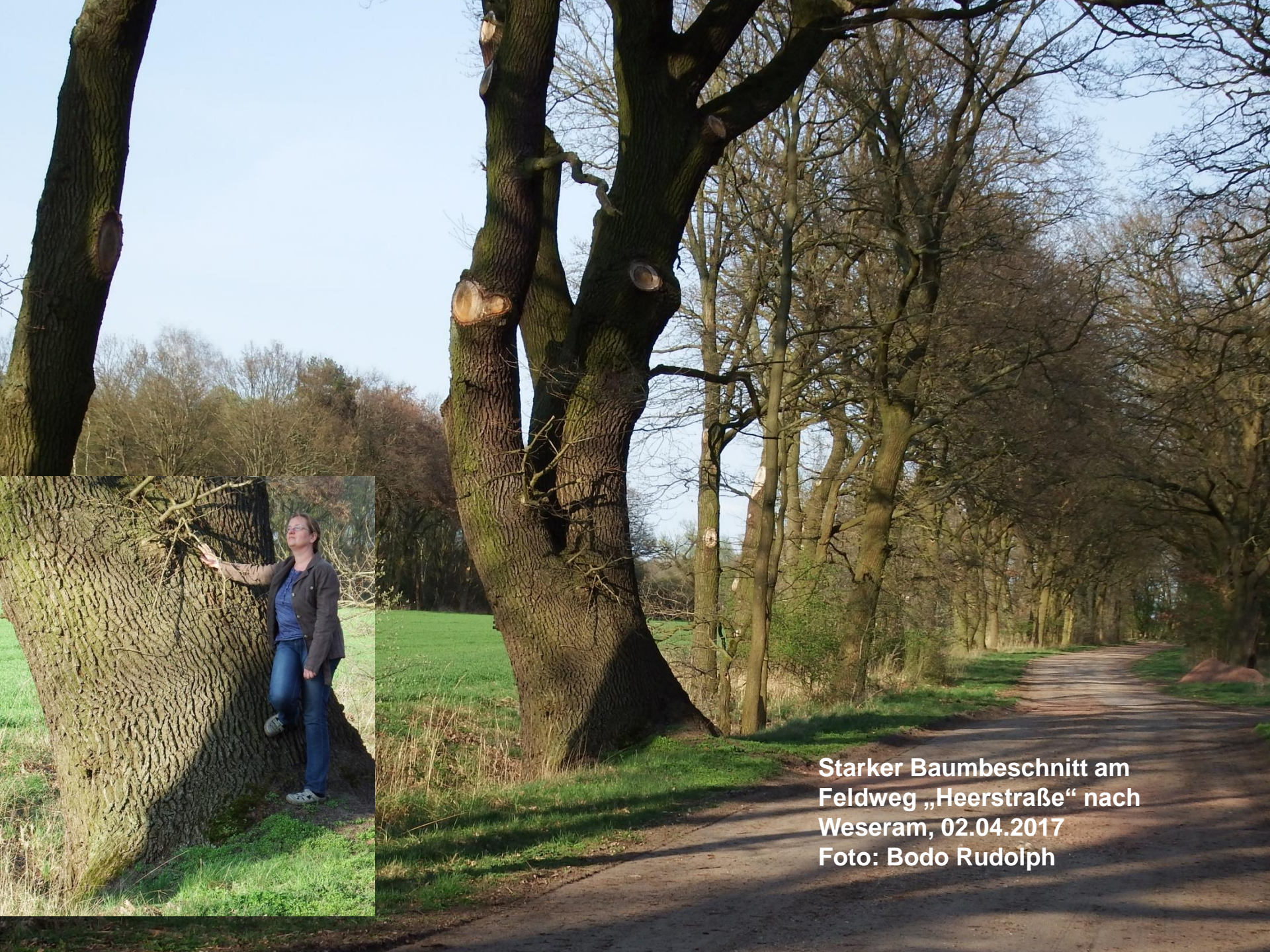
Starker Baumbeschnitt am Feldweg „Heerstraße“ nach Weseram, 02.04.2017