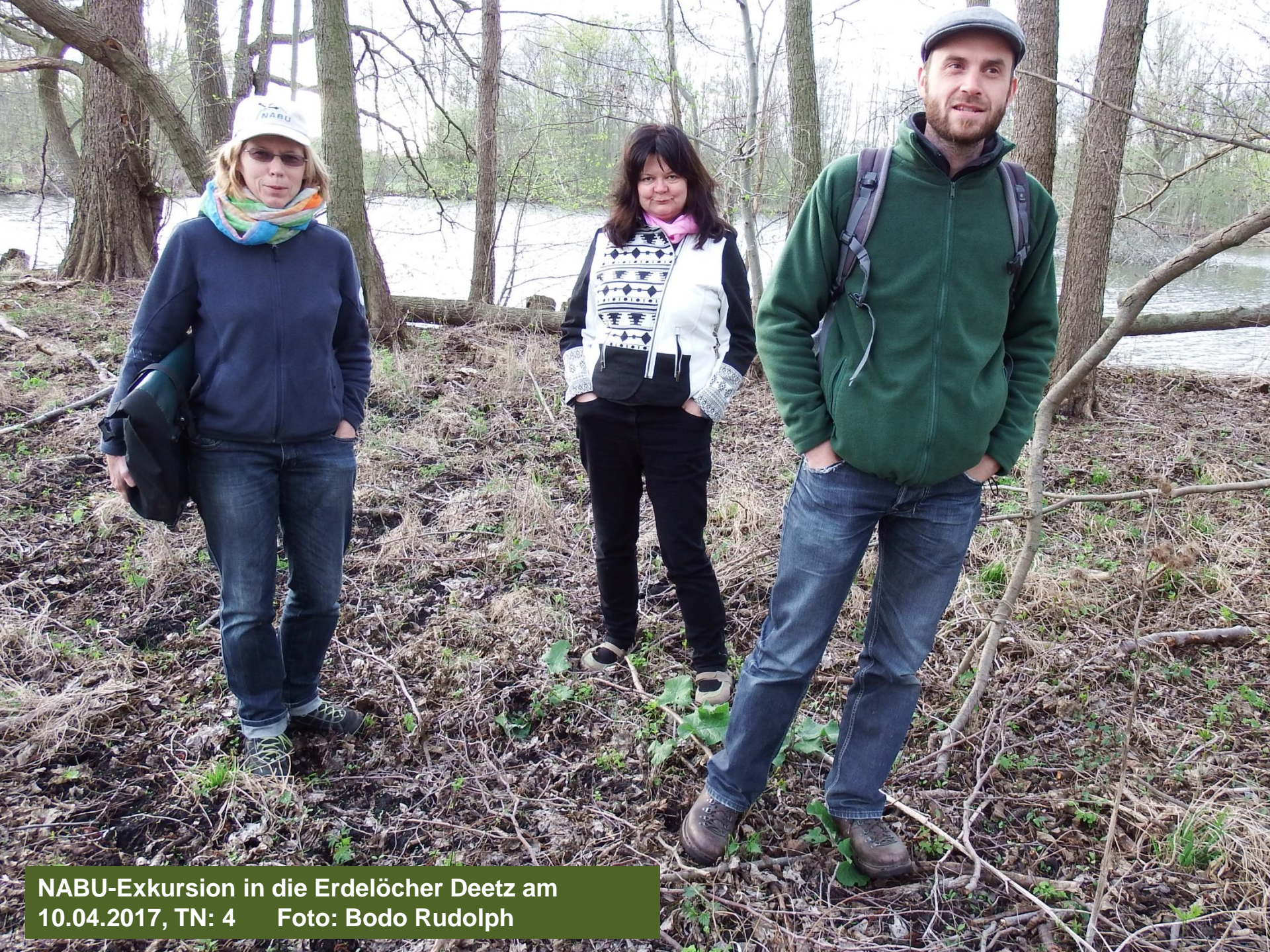
NABU-Exkursion in die Erdelöcher Deetz am 10.04.2017, TN: 4