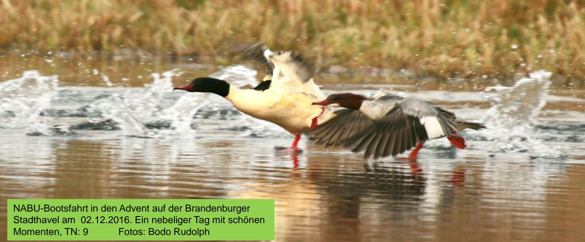
NABU-Bootsfahrt in den Advent auf der Brandenburger Stadthavel am 02.12.2016. Ein nebeliger Tag mit schönen Momenten, TN: 9