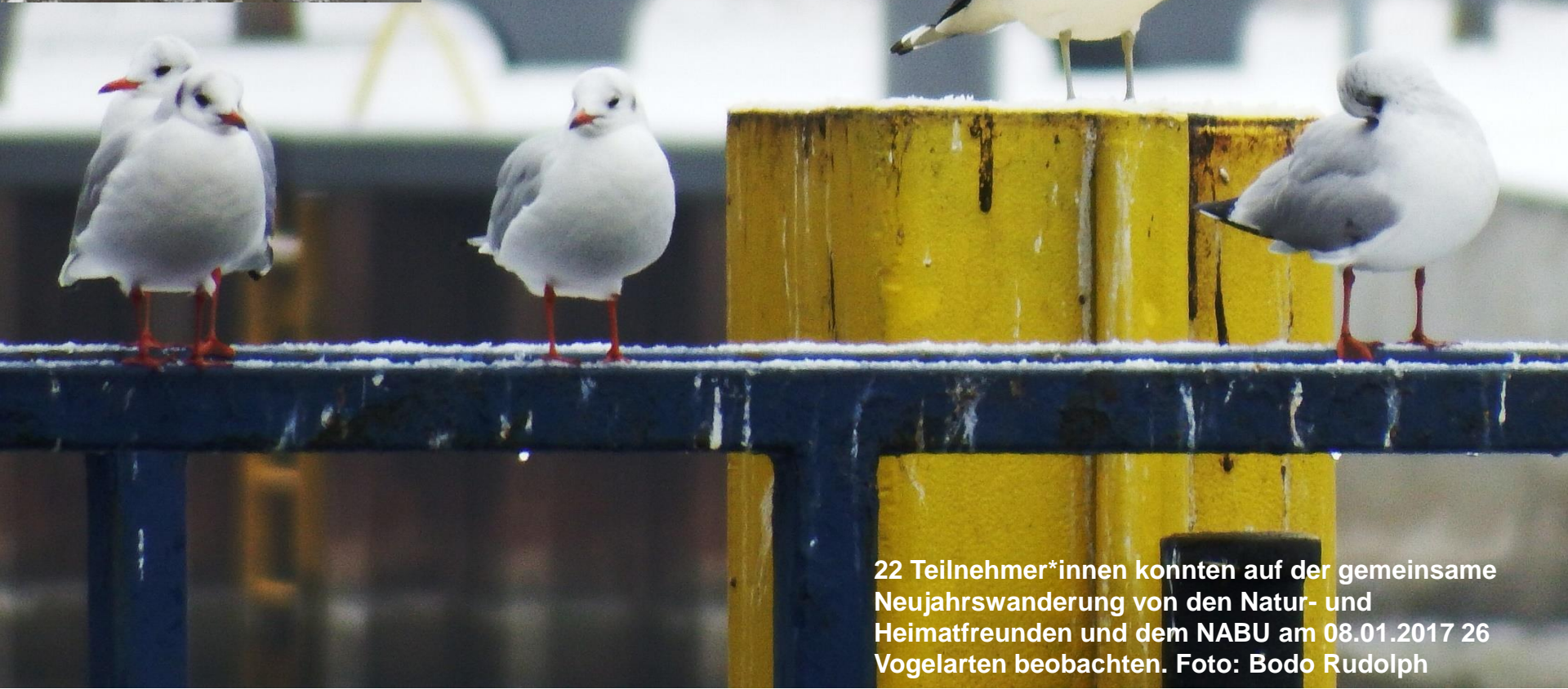
22 Teilnehmer*innen konnten auf der gemeinsame Neujahrswanderung von den Natur- und Heimatfreunden und dem NABU am 08.01.2017 26 Vogelarten beobachten.