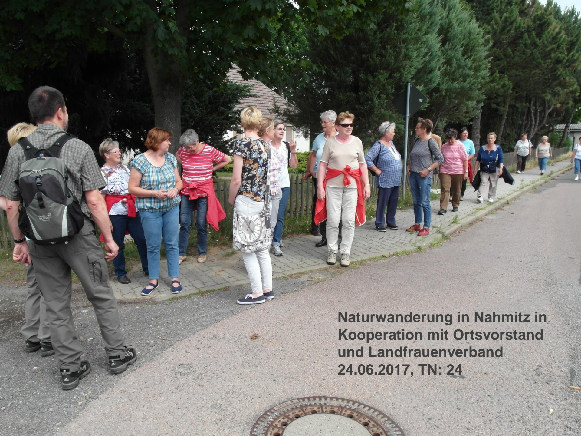
Naturwanderung in Nahmitz in Kooperation mit Ortsvorstand und Landfrauenverband 24.06.2017, TN: 24