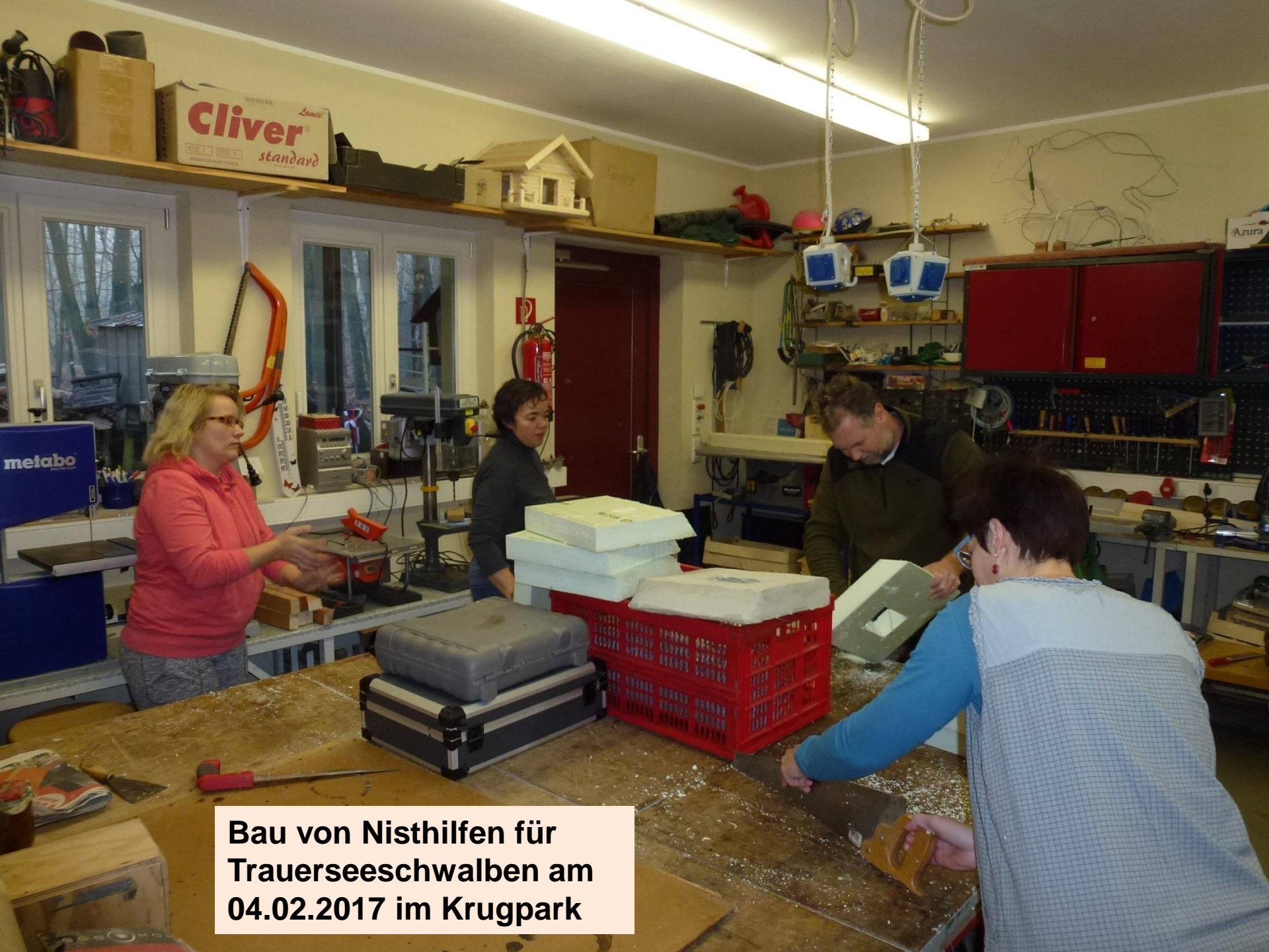
Bau von Nisthilfen für Trauerseeschwalben am 04.02.2017 im Krugpark