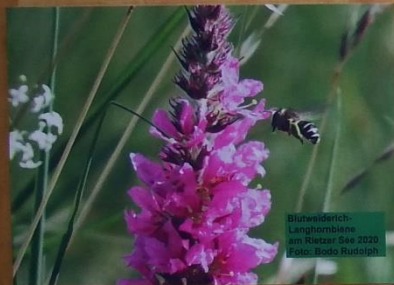
Bluhwiderich- Lampyrisblume am Bietzer See 2020

Teilnehmende sollen 10 m 2 zur Verfügung stellen können. Bei der Samenmischung wird es sich um eine artenreiche einheimische Mischung handeln z. Bsp. die Mischung "Naturgarten" von Yosana (s. a. Anhang). Von jeder Projektfläche sollte in jedem Fall eine Fotodokumentation gemacht werden, um den Projekterfolg zu dokumentieren und unseren Förderern eine Rückmeldung geben zu können.