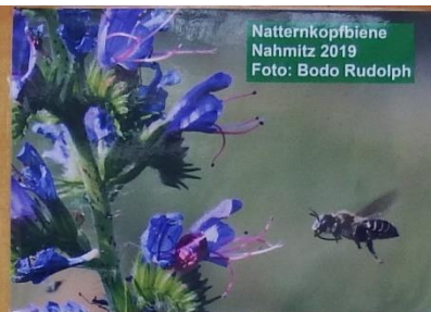
Natternkopfbiene Nahmitz 2019

Wir suchen Projektpartner für die Anlage von 100 Blumenwiesen in unserer Region und werden die spezielle Samenmischung dafür finanzieren.