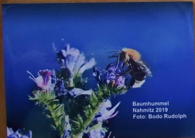
Baumhummel Nahmitz 2019