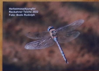
Herbstmosaikjungfer Reckahner Teiche 2022

Teilnehmende sollen 10 m 2 zur Verfügung stellen können. Bei der Samenmischung wird es sich um eine artenreiche einheimische Mischung handeln z. Bsp. die Mischung "Naturgarten" von Yosana (s. a. Anhang). Von jeder Projektfläche sollte in jedem Fall eine Fotodokumentation gemacht werden, um den Projekterfolg zu dokumentieren und unseren Förderern eine Rückmeldung geben zu können.