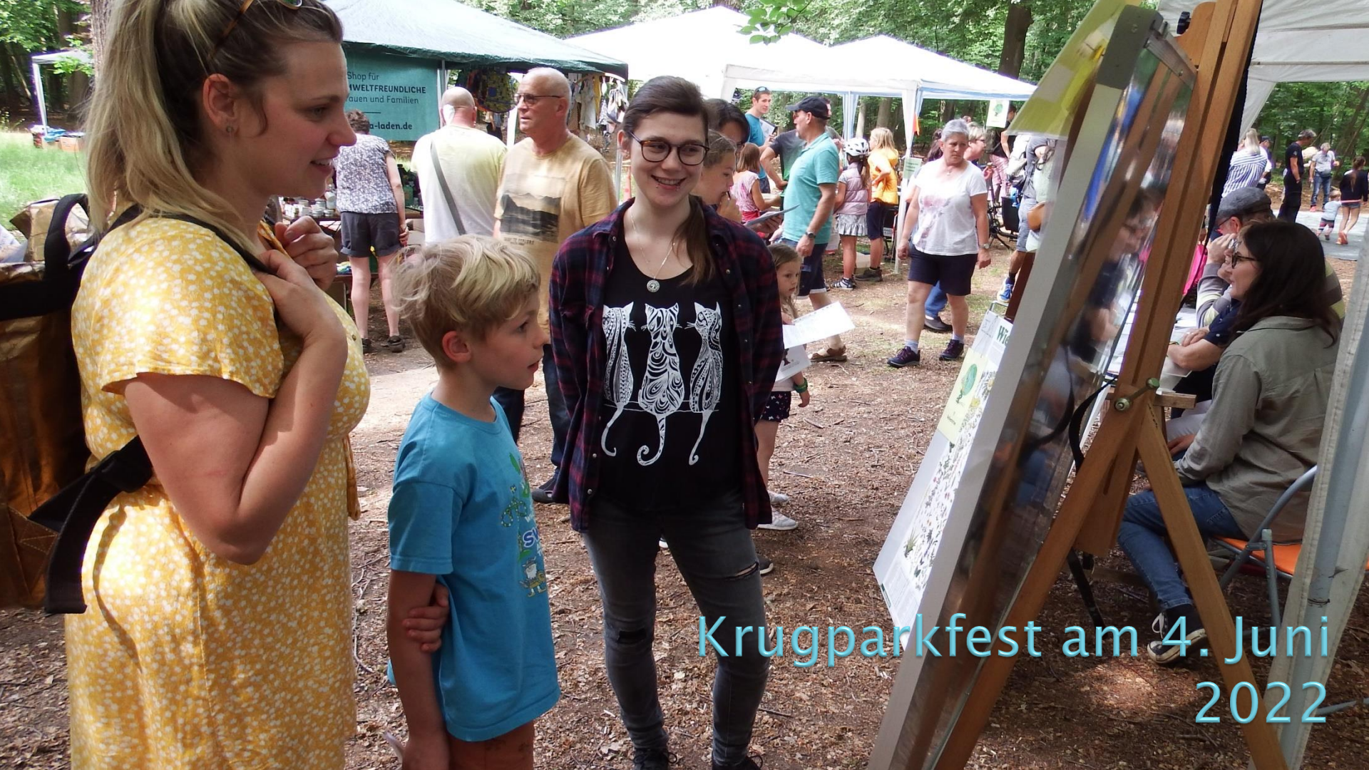
Krugparkfest am 4. Juni 2022