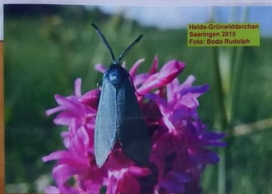
Helde-Grünwiderchen Saarlingen 2019